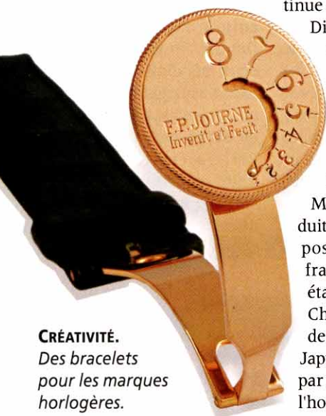
CRÉATIVITÉ. Des bracelets pour les marques horlogères.